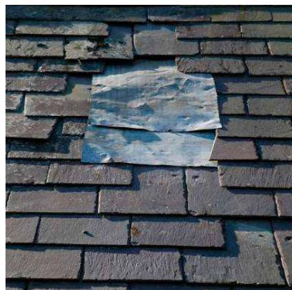
Aangevuld met dezelfde soort leien en hetzelfde gekkingspatroon: vergunningvrij