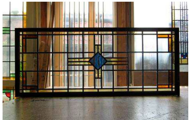
Glas lood raam uitgenomen, hersteld en met dezelfde glasoort teruggeplaatst: vergunningvrij