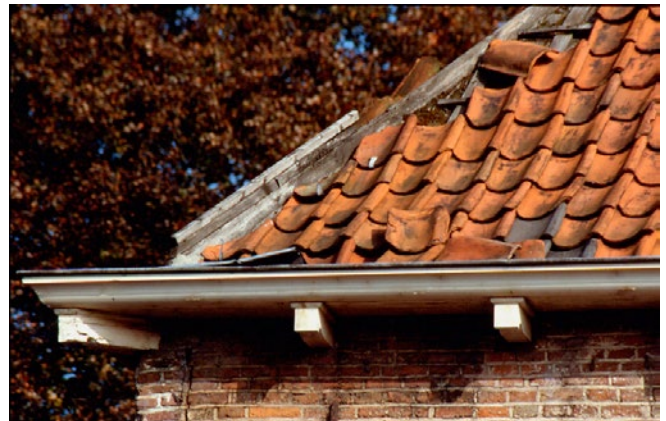
Herstel lood en pannen conform bestaande toestand: vergunningvrij