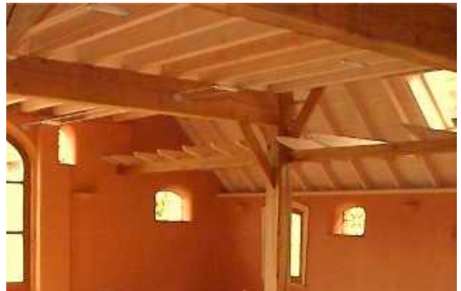
Aanbrengen binnenisolatie. Vergunning nodig.