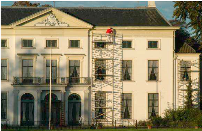
In dezelfde kleur overgeschilderd: vergunningvrij