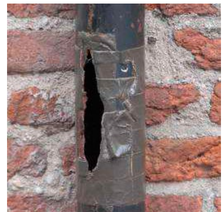
Kapotte delen van de hemelwaterafvoer met hetzelfde materiaal vervangen: vergunningvrij