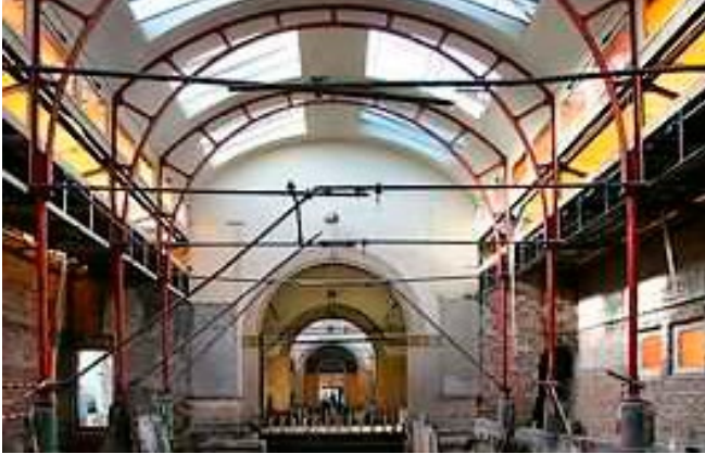
Volledig cascoherstel. Vergunning nodig.