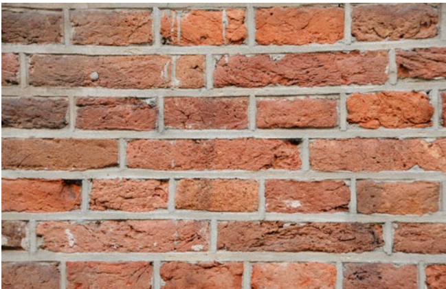
Volledig vervangen van voegwerk. Vergunning nodig.