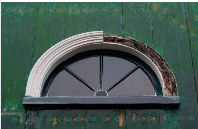
Herstel houtwerk vergunningvrij als detaillering, profilering, vormgeving, materiaal-soort en kleur dezelfde blijven